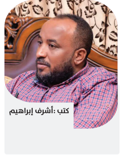
كتب: أشرف إبراهيم