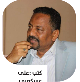
كتب: علي عسكري

صحت الخرطوم على دوى هائل من الانفجارات وصوت الطلقات وتبادل القصف والمدفعية الثقيلة والراجمات و ازيز الطائرات وانفجارات في كل الجهات وحرائق ودخان كثيف يسد الافق من كل الاتجاهات. فجأة تحولت المدينة الهادئة في شهر رمضان وعطلة السبت الى ساحة حرب في مدنها الثلاثة واختلط حابلها بنابلها . سرعان ما تبع ذلك انقطاع خدمات الماء والكهرباء ووجد مئات الالاف من الناس انفسهم دون سبب في وسط ميدان المعركة و دون ان يعلموا الى اين يتجهوا وكيف يعودوا الى منازلهم، فإطلاق النار والقصف يأتي من جميع الاتجاهات. تقطعت بهم السبل فجأة فلجأوا الى ازقة الاسواق حماية لانفسهم من القصف العشوائي الذي يأتي من مصادر متعددة.